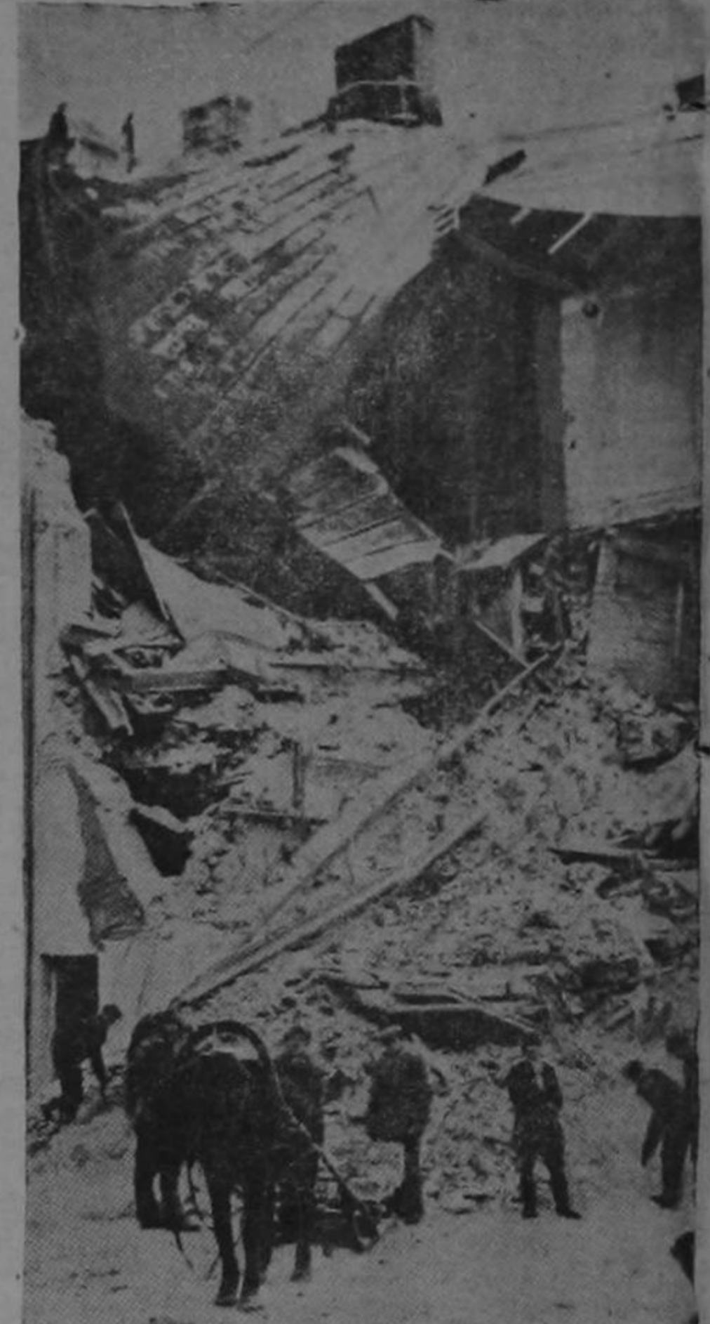
LAS BOMBAS RUSAS DESTRUYEN EL CONSULADO HOLANDES.—Estas ruinas son las de la casa que ocupaba el consulado de Holanda en una población de la Finlandia del Norte, después de que los aviones soviéticos volaron sobre ella y dejaron caer algunas bombas.